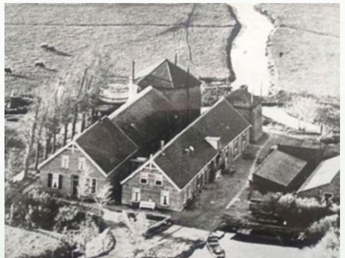
Boerderij aan de Stroomsloot.