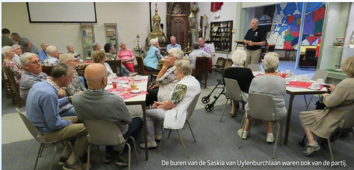
De burens van de Saskia van Uylenburchlaan waren ook van de partij.