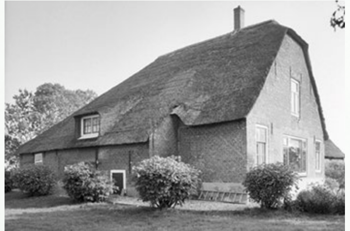
De huidige Moppehoeve.