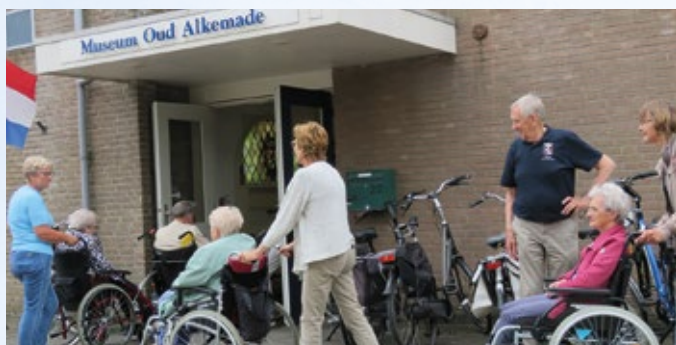
Met hulp van de vrijwilligers kan iedereen naar binnen.

De vraag van de gemeente en organisatie De Driemaster leek zo simpel, maar was het zeker niet: “Haal de ouderen van onze gemeente uit het isolement waar ze door de coronacrisis in zijn beland” .