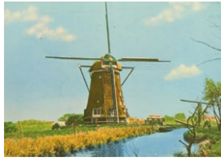
De Heilige Geestmolen op een ansichtkaart uit 1975 van Rien de Koning.

Bij het eerste kruispunt sloegen ze rechtsaf. De weg liep hier dicht langs de dijk van de Brasem, die wat hoger lag, zodat ze het water alleen konden horen klotsen tegen de schoeiingen. In het weiland voor de dijk stond een afgetakelde molen, met een kleine schuur ernaast. Hij kraakte en piepte in de wind. Bomen waren hier