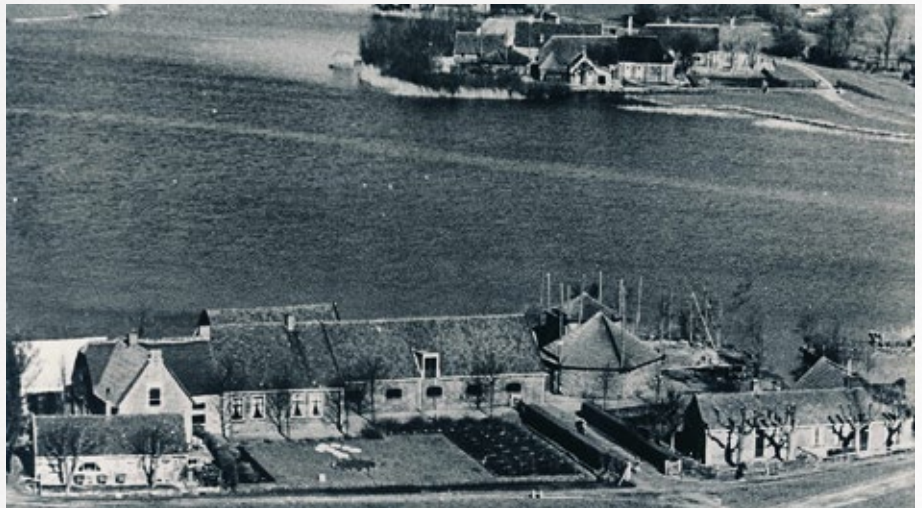
Links het oude molenaarshuis annex grutterij, rechts het nieuwe. In het midden de boerderij van de familie Bisschop, gebouwd in 1907. Foto uit 1951.

In 1785 bouwde Huijg van der Velden een nieuw huis bij de korenmolen. Op de luchtfoto zie je het pand helemaal rechts. Hij verhuurde het aan Gerrit de Heus