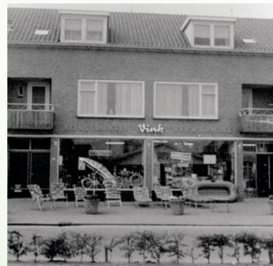
De winkel van Vink in de jaren zestig.