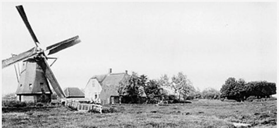
De korenmolen met het molenaarshuis; rechts achter de bomen ligt het in 1785 gebouwde molenaarshuis. Foto gemaakt in 1905 of eerder.