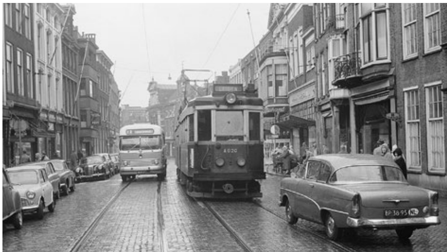
De blauwe tram in de Breestraat in Leiden. Op 9 november 1961 was de laatste rit van de Blauwe tram van Leiden naar Den Haag

Twee en een half uur later kwamen ze tot op hun huid doorweekt Leiden binnen, bij de Spanjaardsbrug. Het liep tegen half vijf. Bij dit weer waren de straten bijna uitgestorven. Het begon al te schemeren. De wind was in de loop van de middag iets minder geworden. De regen was eerder toe- dan afgenomen, maar hield nu plotseling op. Koud, nat, en moe liepen ze de Breestraat door. In een winkel kocht Klaas twee koeken. Werktuiglijk kauwend liepen ze door tot de blauwe tram en alsof ze dat zo hadden afgesproken, bleven ze bij de halte staan.”