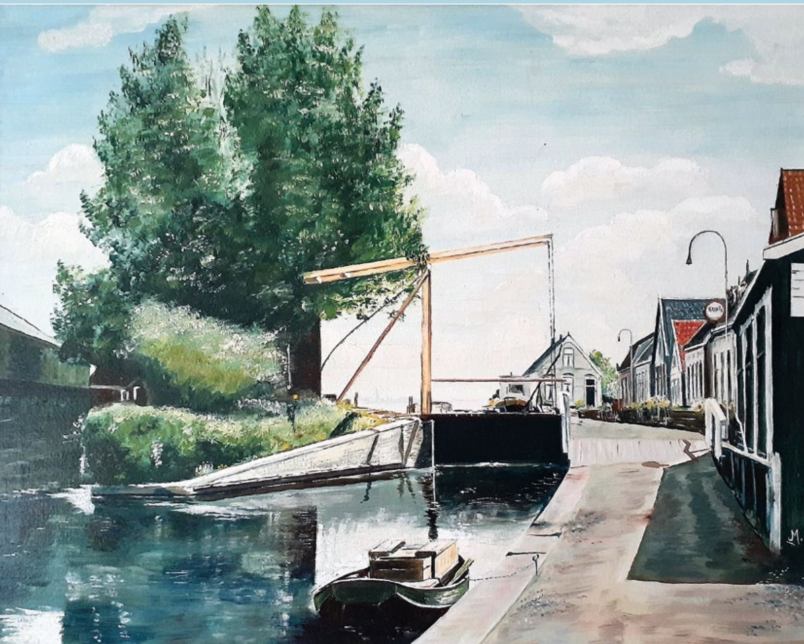
De sluis in Roelofarendsveen, geschilderd door Joop van der Meer (Johanzn)

Wat oude bidprentjes kunnen vertellen (deel 3)