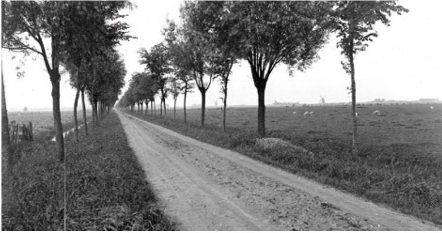
De Ripselaan in ca. 1900 met de Lijkermolens 1 en 2 aan de horizon.

bus achterop. Toen hij toeterde, weken ze uit naar de zijkant van de weg om hem te laten passeren en deden snel nog een pas opzij voor het onder de banden wegspuitende water. Ze keken hem na.