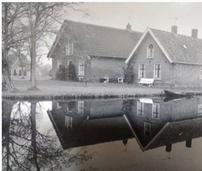
Boerderij Het Klaverblad.