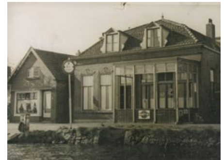
Hotel Meerzicht alias Café Klein met veranda tegenover de veerpont, ca. 1940.

Ze draaiden zich, nog kauwend, om. Voordat ze twee minuten gelopen hadden, begon het opnieuw te regenen.