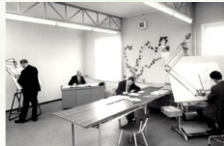
De tekenkamer in de jaren zeventig.

Ik sta er niet alleen voor, ik weet me gesteund door bijzonder betrokken werknemers. Bovendien loopt mijn oudste zoon nu een aantal jaar mee in het bedrijf. Ondanks dat ik het nog goed naar mijn zin heb, gaan we een stappenplan maken, zodat het bedrijf voortgezet kan worden door de volgende generatie.”