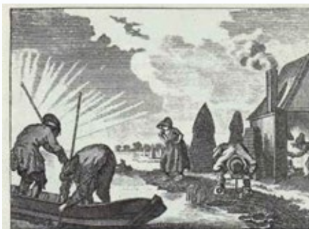
Turf is vaderlandische brand; stook toch niet te veel. Van des grond, waarop gy woont, is de Turf een deel.

De Buijssants hadden verstand van textiel en geld, maar niet van de Rijnlandse reglementen.