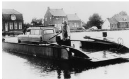
De pont met Gijs van Staveren in slecht weer (met dank aan Nel van de Weteringh-van Staveren).

nergens meer. Het land was kaal en kleurloos. Door de hoger liggende dijk werd de wind, die weer schuin van voren kwam, iets gebroken. Soms zag je een regen van druppels boven de dijk uit spatten. In Oude Wetering werden ze met de veerpont over de uitloper van het meer gezet. Klaas ging bij de veerman staan, die de boot aan een kabel over het water trok. Maarten stond iets terzijde. Het water was woelig en kletste tegen het hout van de pont. Aan de overkant stond een lange rij lage huisjes, sommige met grote, vooruitspringende veranda's.