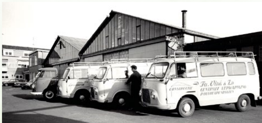
Het bedrijf aan het Zuideinde.