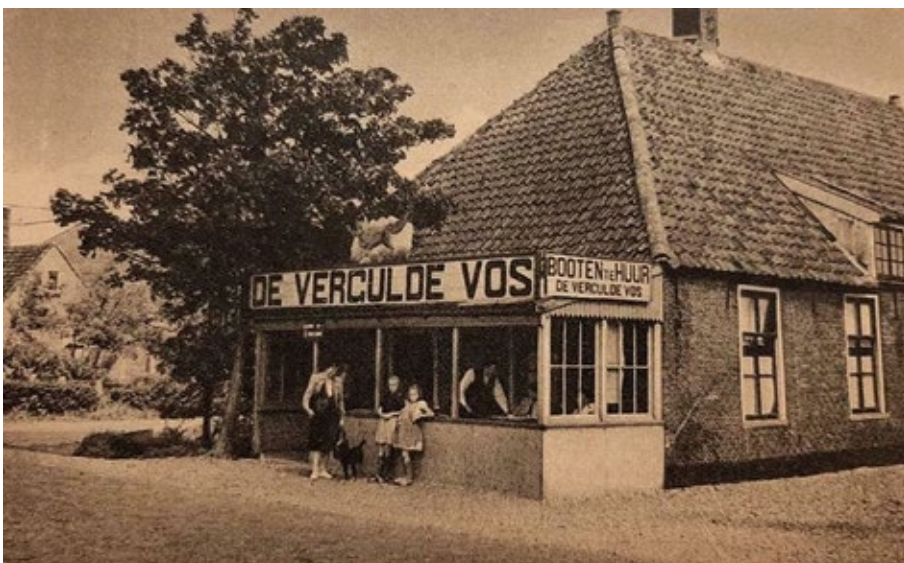
De Vergulde Vos in de jaren veertig van de vorige eeuw.

“Dit is toch eigenlijk wel een verdomd goede critiek op de auto,” zei Klaas tevreden.